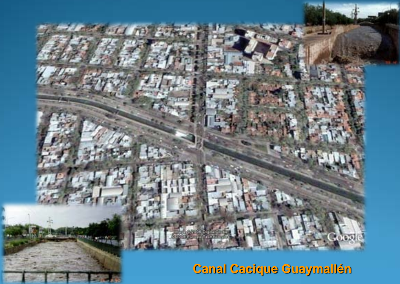
Canal Cacique Guaymallén